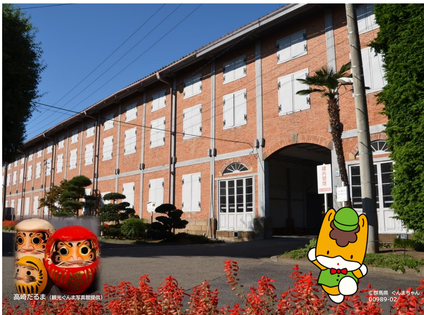
高崎だるま