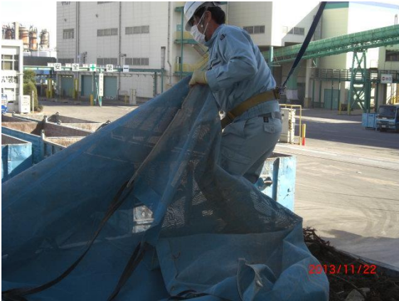
1-①-1 大型車でのシートかぶせ作業