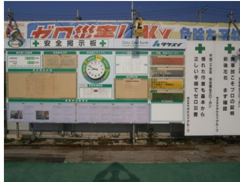
2-①-2 安全ボードの全景