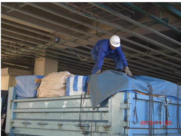
1-②小型運搬車でのシート取り外し作業