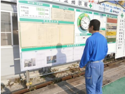
2-①-1 ボードに見入る乗務員