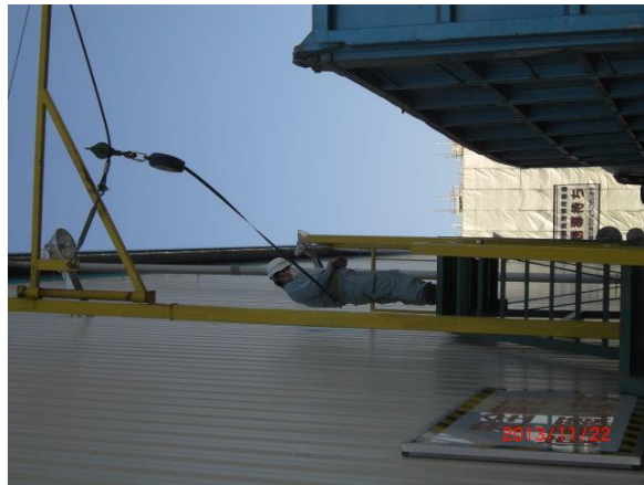
1-①-2 大型車用の安全帯取り付け装置